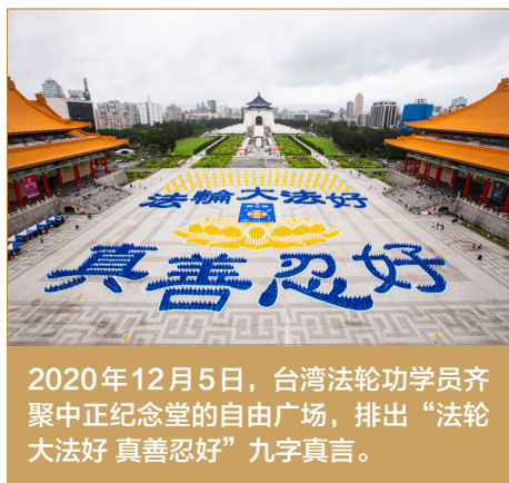
2020年12月5日，台湾法轮功学员齐聚中正纪念堂的自由广场，排出“法轮大法好 真善忍好”九字真言。

年终评先进，大伙都选他。领导说：“不能选法轮功（学员）。”大伙说：“不选他，我们就不选了。”结果法轮功（学员）当上了先进工作者，这可是名副其实的。