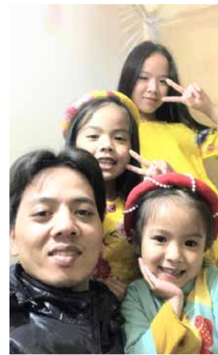
■ 秋燕的丈夫和他们的三个女儿。

但是，在最后几轮化疗中，她想到放弃，她的身心被病痛折磨到了极限。“我连续呕吐了四十八个小时，无法进食进水。我记得，我乞求丈夫