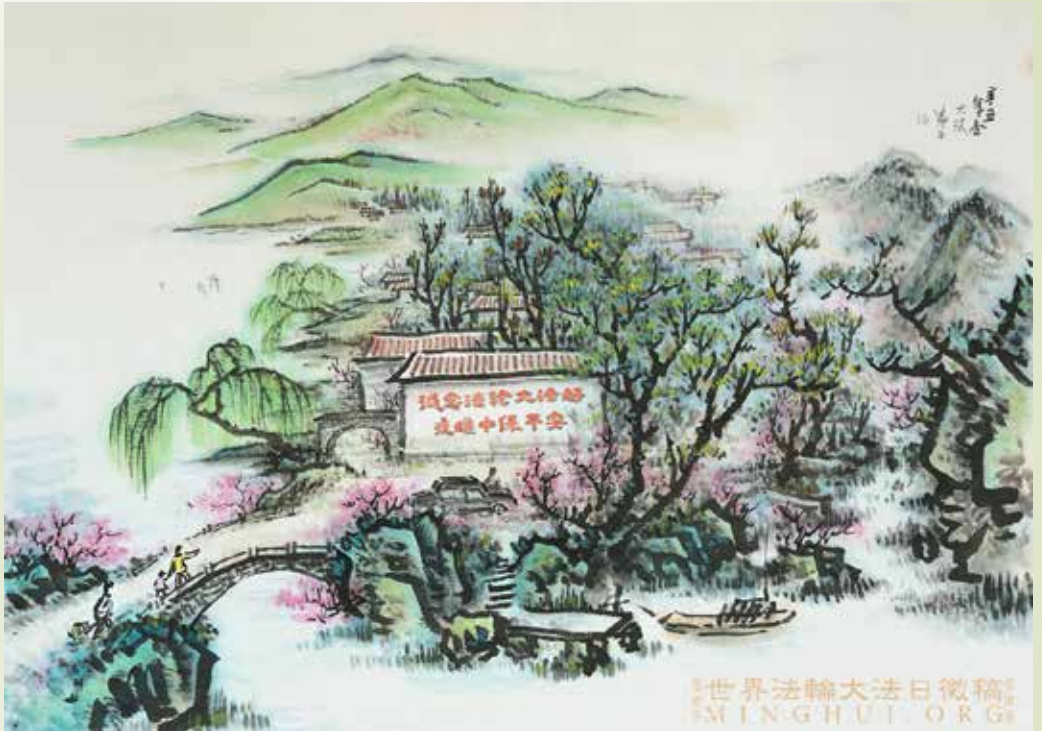
山水画：传福音 作者：大陆大法弟子