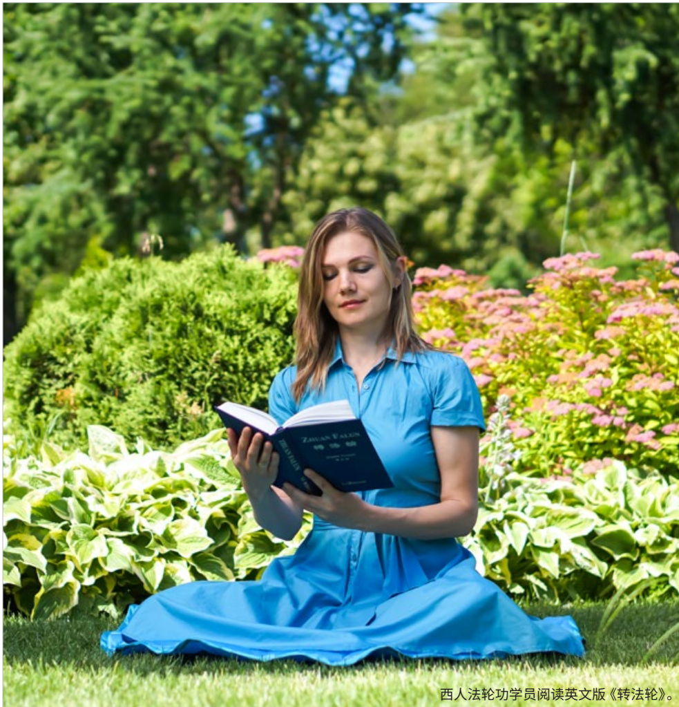
西人法轮功学员阅读英文版《转法轮》。