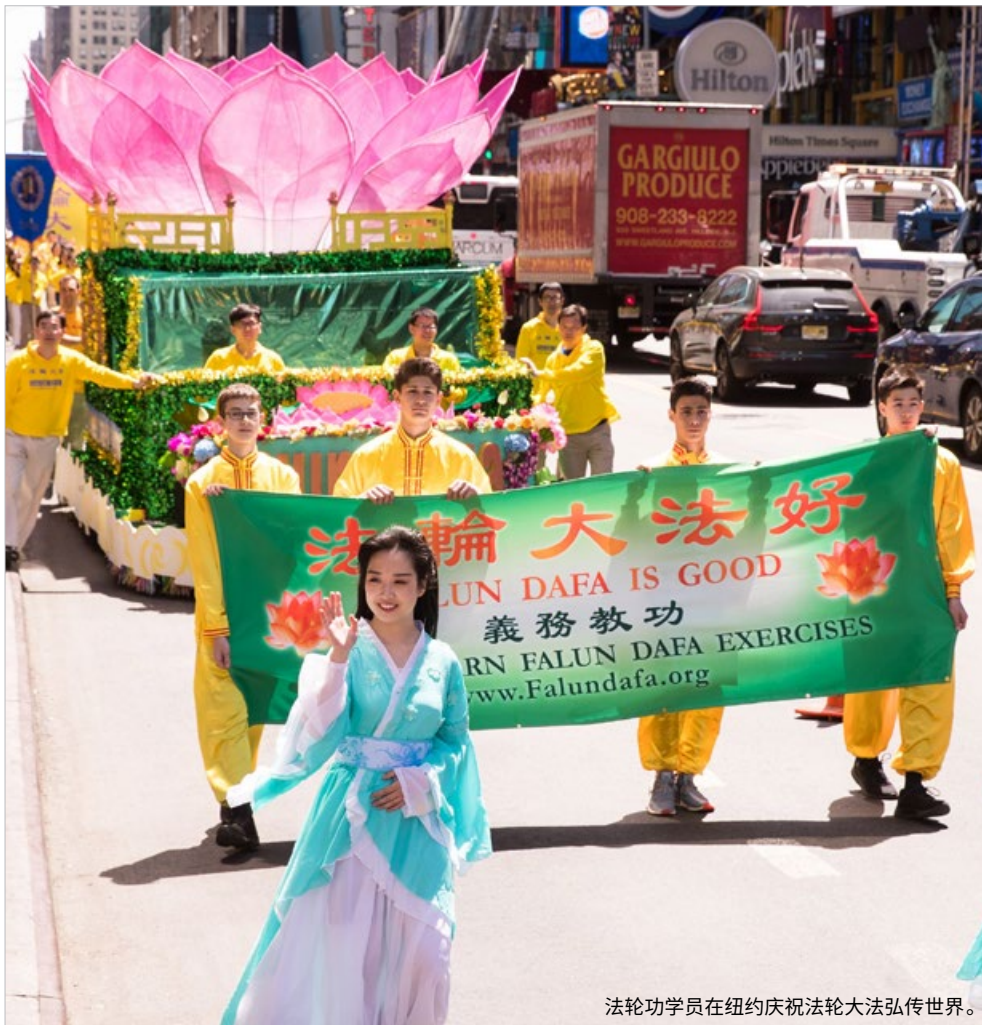
法輪功學員在紐約慶祝法輪大法弘傳世界。