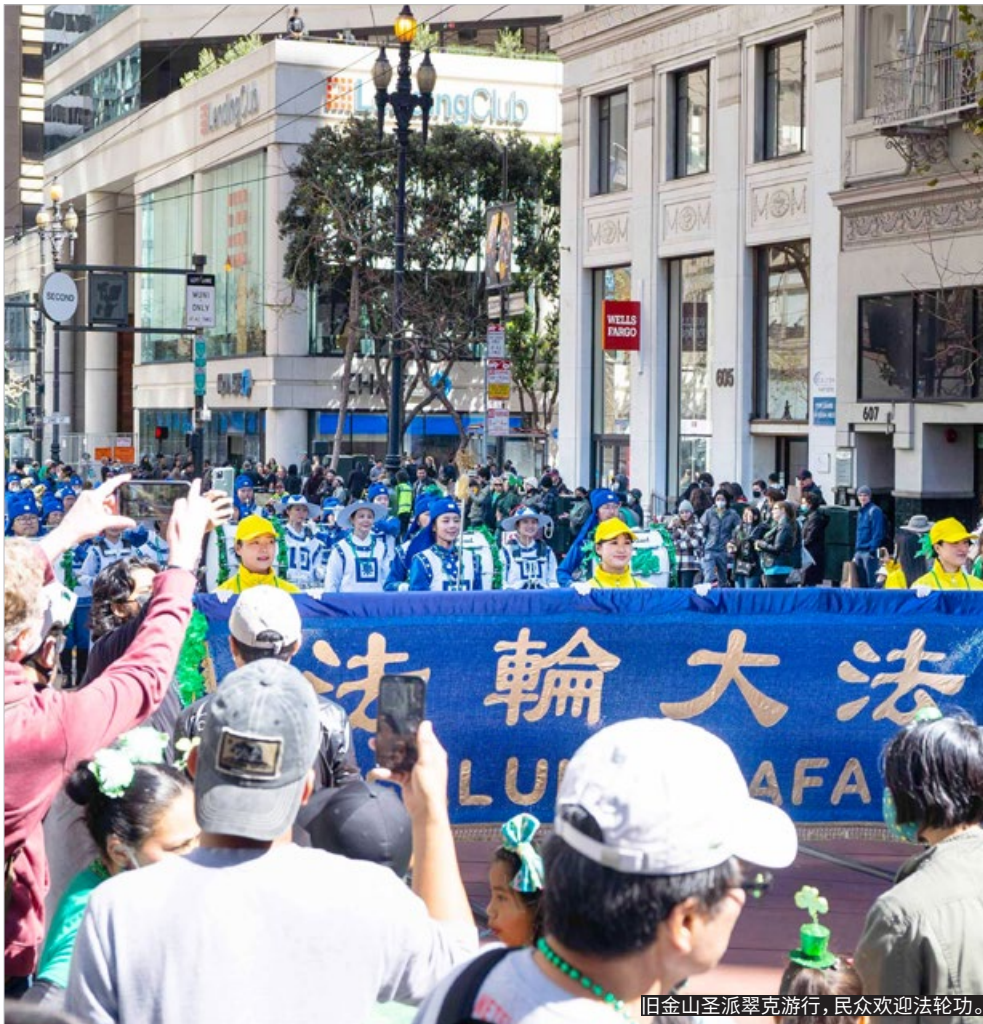
旧金山圣派翠克游行，民众欢迎法轮功。