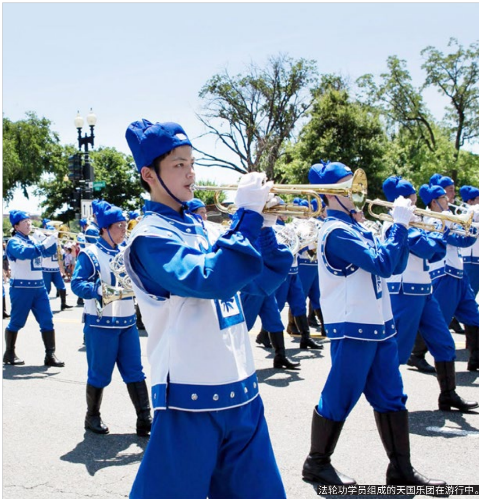
法轮功学员组成的天国乐团在游行中。