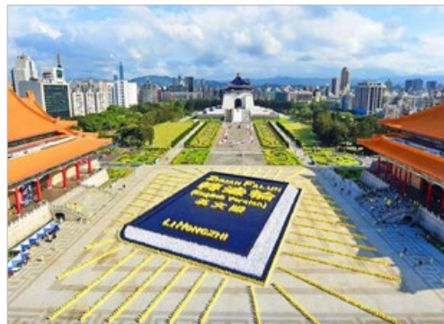
5000 多名法轮功学员在台北自由广场排出《转法轮》英文版的书模，场面壮观殊胜。