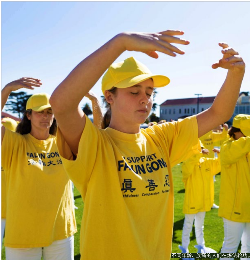
不同年龄、族裔的人们在炼法轮功。