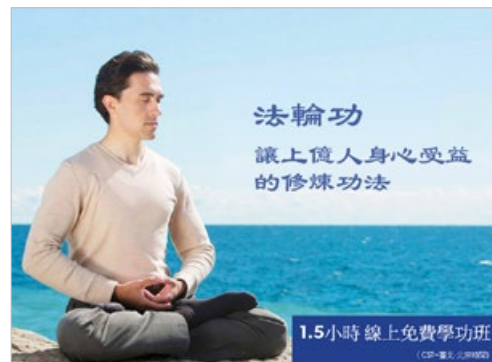
2020年4月以来，全球90多个国家的2.2万人参加了法轮功免费网上教功班。