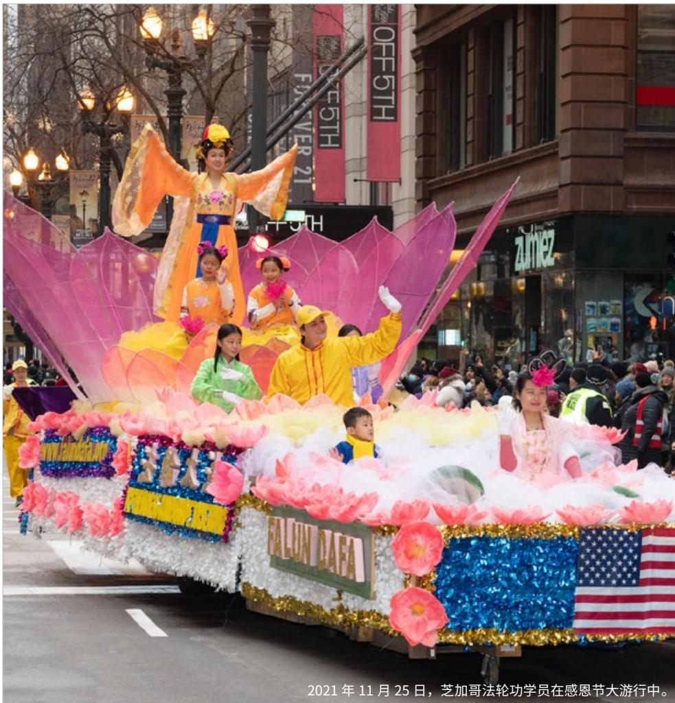
2021年11月25日，芝加哥法轮功学员在感恩节大游行中。