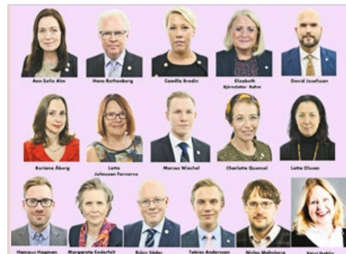
2022 年 5 月，16 位瑞典政要恭贺法轮大法传世 30 周年并说真、善、忍是重要的普世价值。