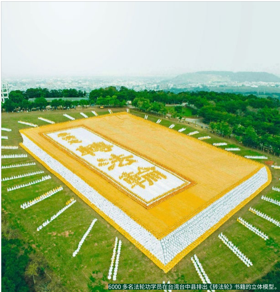
6000 多名法轮功学员在台湾台中县排出《转法轮》书籍的立体模型。

24 25 26 27 28 29 30 初十 十一 十二 十三 十四 中秋节 十六