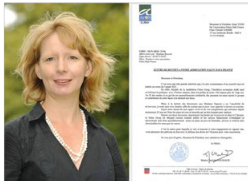
法国大巴黎地区阿翁市市长玛丽·夏洛特·努奥感谢法轮功学员给当地带来和谐与善良风气。