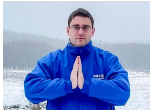
菲利普修炼法轮功不久，工作和生活都恢复了正常，他感恩师父让他看到光明和希望。

“2014 年是我人生的转折。我读了法轮大法的著作《转法轮》之后恍然大悟，明白了人生意义是按照宇宙特性真、善、忍修炼，返本归真。修炼后，喝酒、玩游戏的毛病一下子就戒掉了，浑身充满能量，跑步像飘起来一样，我无需再去找理疗师了。法轮大法使我的心灵得到真正的提升，我对师父的感恩道不尽！”