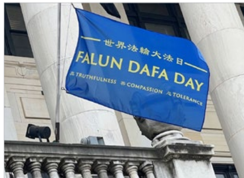
2022年5月12日，美国新泽西州首府升起了法轮大法日旗帜，参众两院联合表彰法轮功。