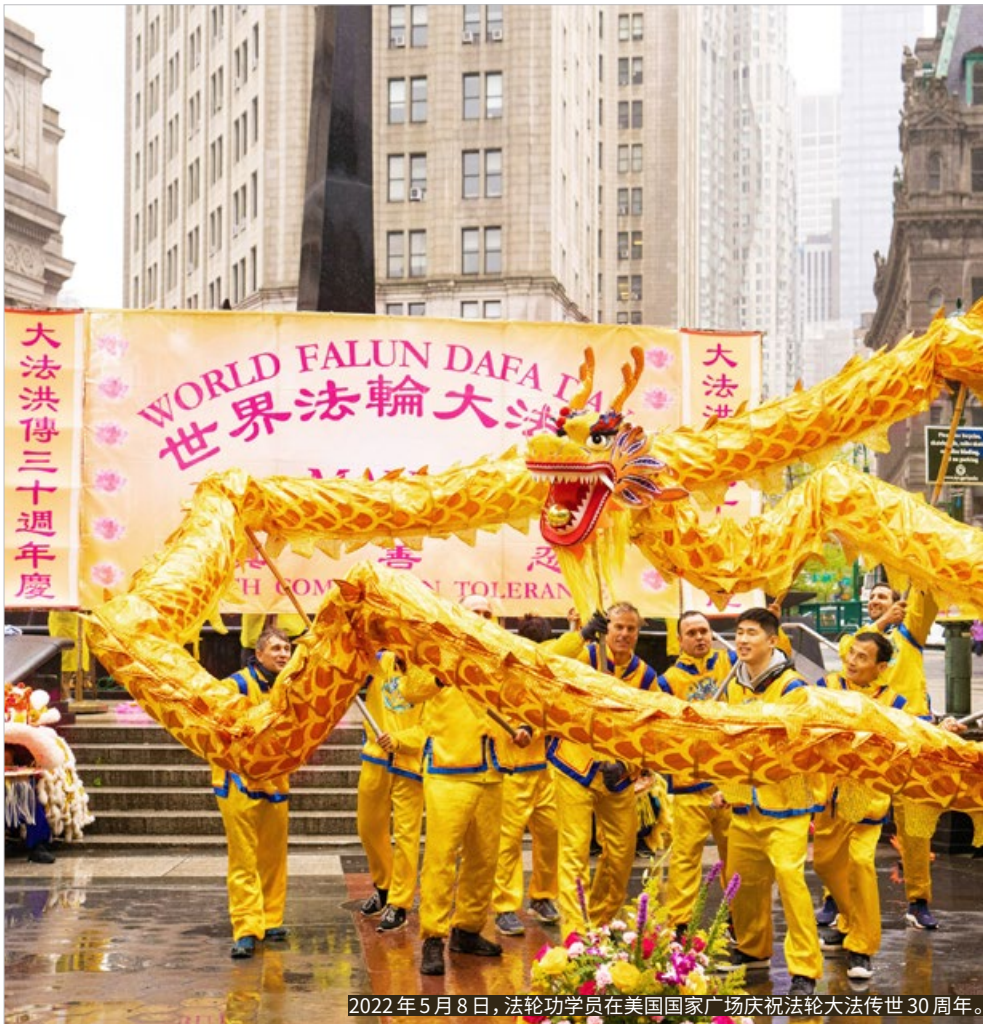
2022年5月8日，法輪功學員在美國國家廣場慶祝法輪大法傳世30周年。