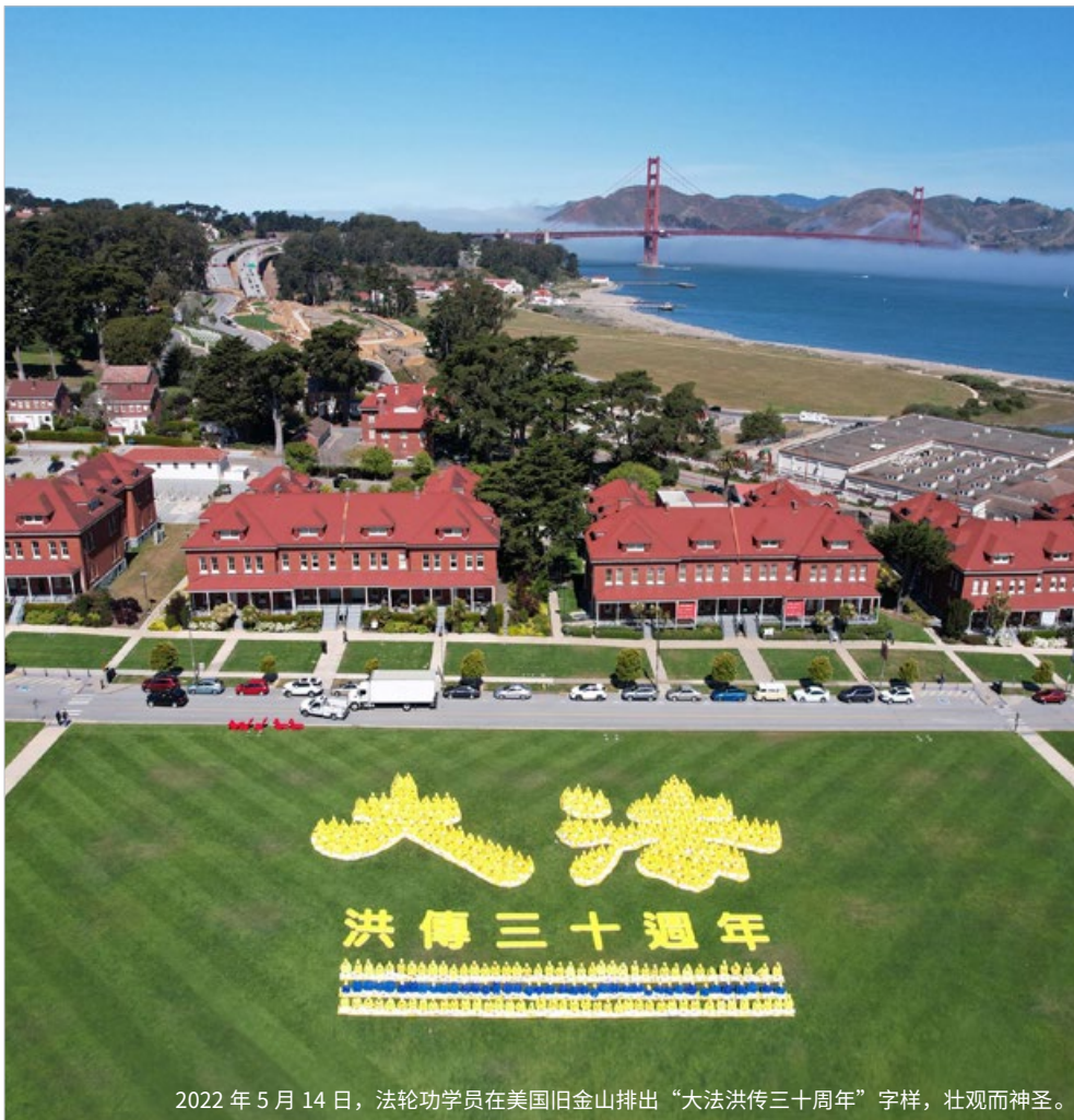
2022年5月14日，法輪功學員在美國舊金山排出“大法洪傳三十週年”字樣，壯觀而神聖。