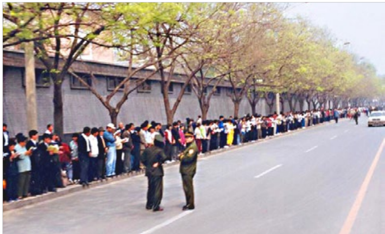
1999年4月25日上访的法轮功学员秩序井然，两名警察在一旁悠闲站立。