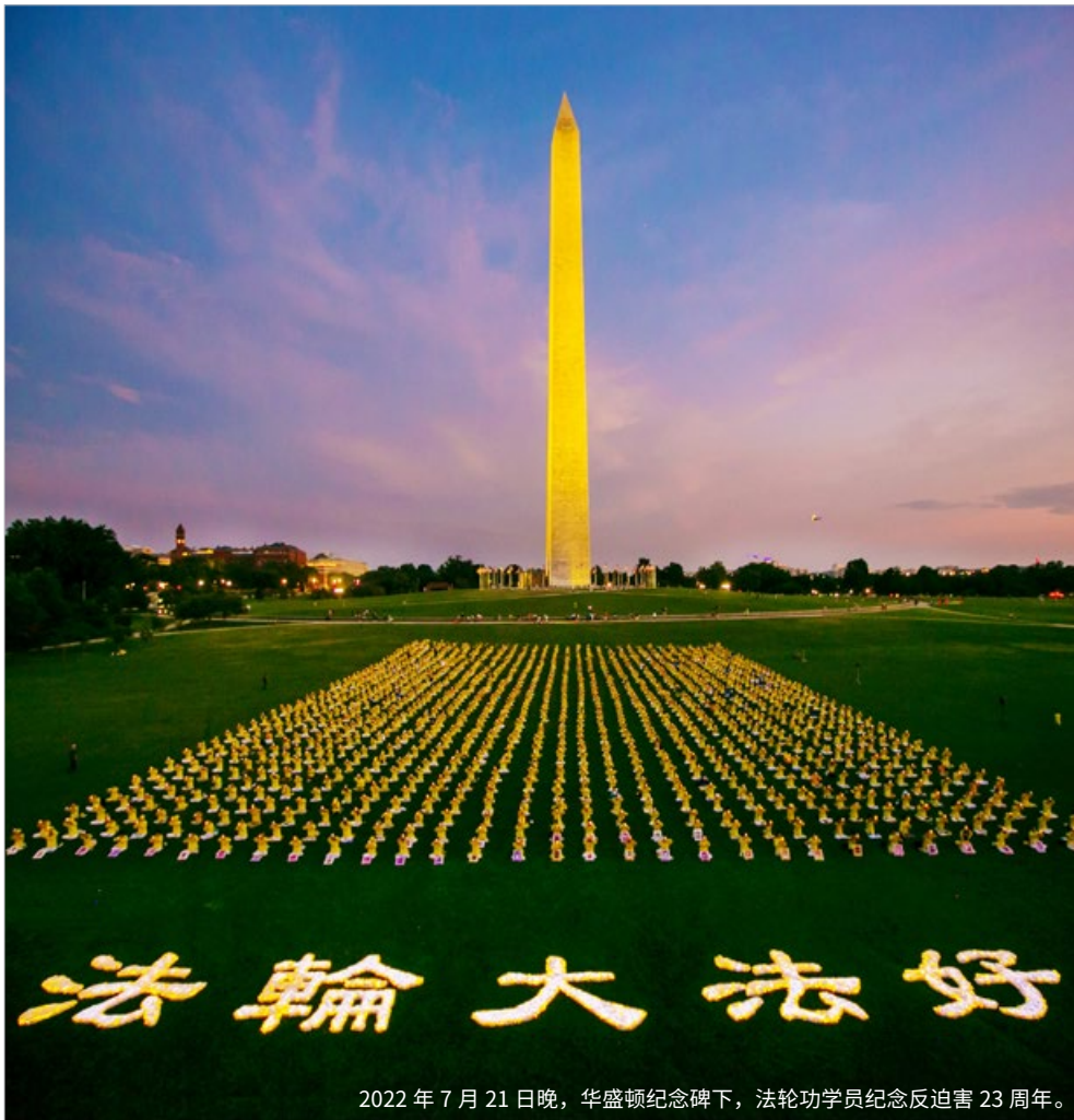
2022年7月21日晚，华盛顿纪念碑下，法轮功学员纪念反迫害23周年。