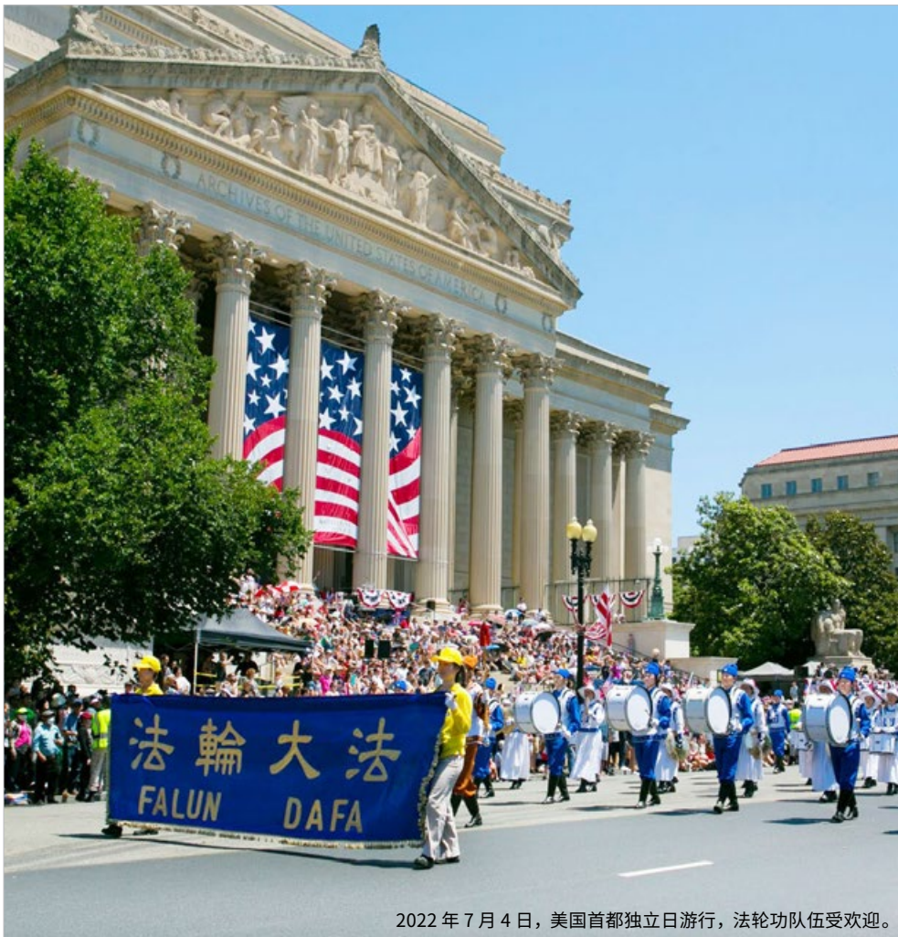
2022年7月4日，美国首都独立日游行，法轮功队伍受欢迎。