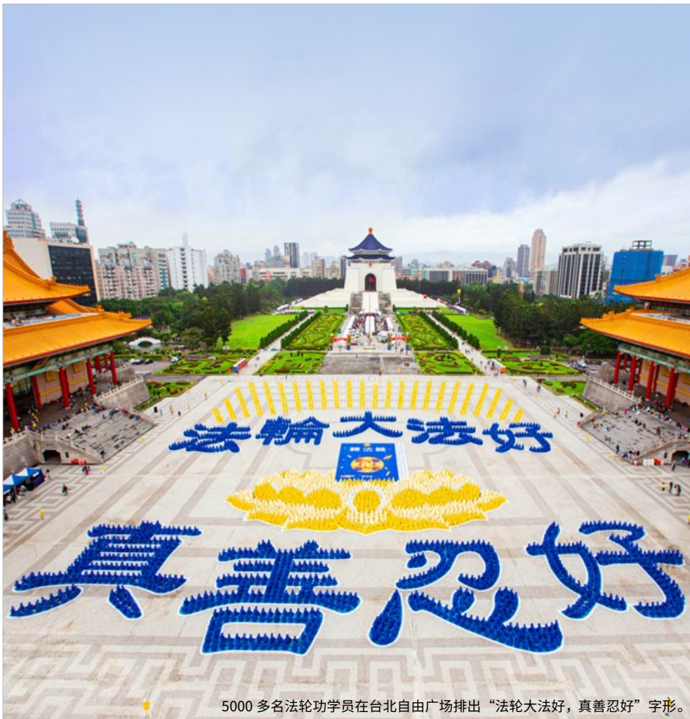
5000 多名法轮功学员在台北自由广场排出“法轮大法好，真善忍好”字形。

24 25 26 27 28 29 30 十二 十三 十四 十五 十六 十七 十八 31 二九 圣诞节