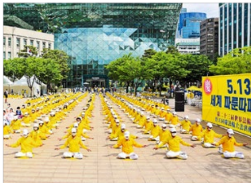
2022 年 5 月 13 日，韩国法轮功学员在首尔广场集体炼功，庆祝法轮大法传世 30 周年。