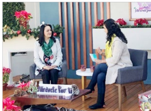
墨西哥电视台邀请法轮功学员（左）在 2021 年圣诞节健康与福祉节目中介绍法轮大法。