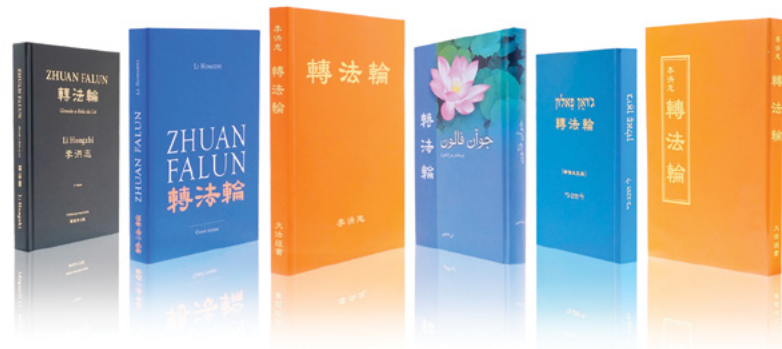
《转法轮》出版近30年，被翻译成40多种语言在世界各地发行。一本奇书改变上亿人。

往医院跑，出院二、三天后又住院！来来回回的，回到家也不好受，躺在床上呻吟着这边痛、那边痛，再加上我的叛逆行为，她气得病情更加严重了！她吃不好、睡不好，有时还不时地流着眼泪说着：“让我赶快死吧！这样你就会懂事点，不会再依靠我了，我应该这几天就会走了吧！”当时我也觉得我真的做错事了，但是嘴上依然很倔强。