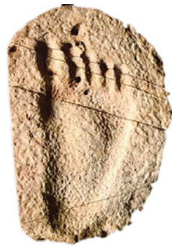
光脚小孩脚印化石