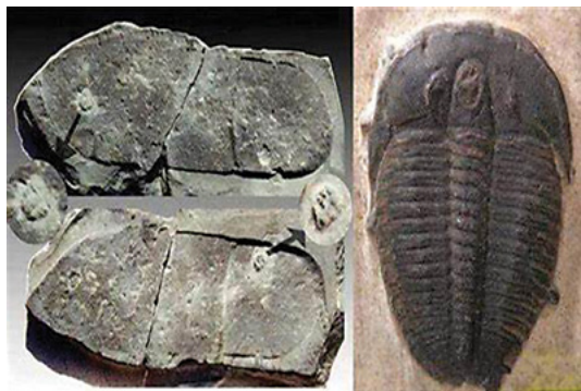
三叶虫鞋印化石（左）箭头处为三叶虫。右图为三叶虫化石放大图

三叶虫是细小的海洋无脊椎动物，与虾蟹同类。在地球上存在时间从6亿年前开始，至2.8亿年前灭绝。而人类的历史与之相比很短，能够穿上像样的鞋子不过才三千多年。这一切又该作何解释呢？我们人类所发现的化石，完全颠覆了我们既有的认知啊。