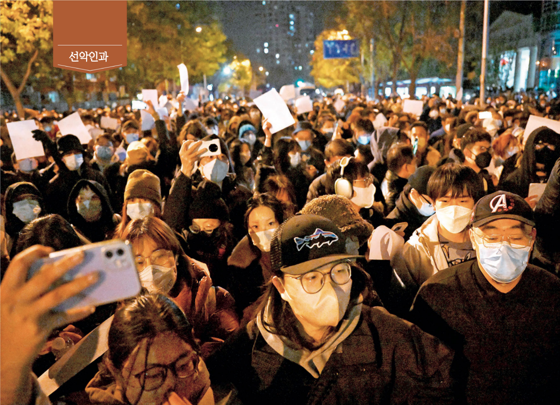
2022년 11월 27일 베이징에서 발생한 집회에서 수많은 민중이 백지를 들어 중공에 항의했다.