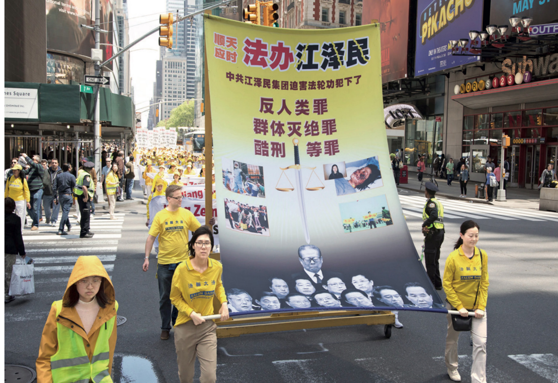
해외 파룬궁수련자들이 수시로 대형 퍼레이드를 열어 장쩌민의 죄악을 세상에 알리고 있다.

2001년 홍콩 잡지 소식에 따르면 장쩌민은 자신이 지은 죄가 너무 커 지옥에 떨어질 것을 알고 지장보살에게 보호해달라고 빌기 시작했다고 했다. 장쩌민은 두려운 마음에 자신의 집에