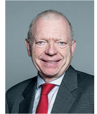
■ 중공의 생체 장기적출 범죄를 비난하는 영국 상원의원 헛트 오브 킹스 경의 희생입니다.”

그는 상원 연설에서 말했다. “전 세계가 중공이 살아있는 양심수의 장기를 적출하고 있는 사실을 점점 더 많이 인식하고 있습니다. 최근 런던 독립법원은 살아있는 피해자로부터 강제로 장기를 적출하는 이 끔찍한 범죄가 광범위한 살인으로 이어지고 있다는 사실을 발견했습니다. 장기이식을 받은 사람은 생명을 연장할 수 있지만 그 대가는 또 다른 무고한 생명