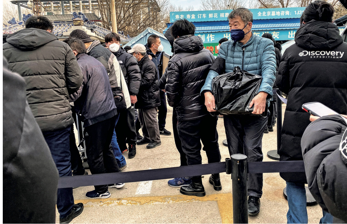
■ 베이징 어느 장례식장 밖 광경

이번 역병과 관련해 파룬궁 창시자 리훙쯔 대사는 《이성(理性)》이란 글에서 직접 명시하셨다. “중공 바이러스(우한 폐렴) 이런 역병은 목적이 있으며, 목표를 가지고 온 것이다. 그것은 사당분자(邪党份子) 및 중공사당(中共邪党)과 함께하는 사람들을