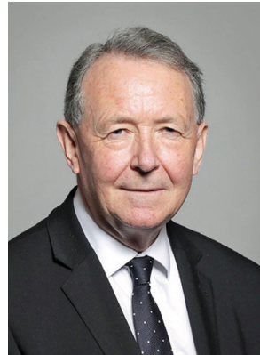
■ 중공의 생체 장기적출 반인류범죄를 규탄하는 영국 상원의원 알튼 경

2022년 12월 10일 국제 인권의 날, 영국 상원의원인 알튼 경(Lord Alton)은 중공의 파룬궁수련생 생체 장기적출 범죄를 규탄하는 특별 동영상 공개했다. 영상에서 그는 파룬궁 근절 명령은 장쩌민 전 중공 총