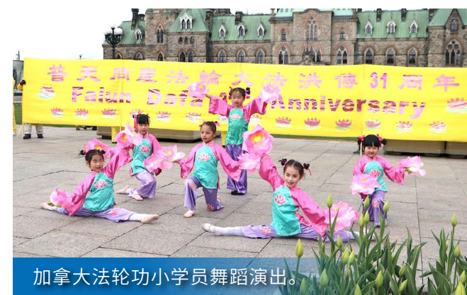
加拿大法轮功小学员舞蹈演出。