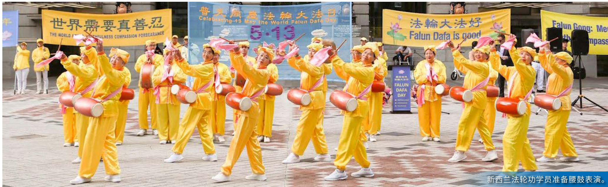
新西兰法轮功学员准备腰鼓表演。