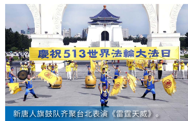
新唐人旗鼓队齐聚台北表演《雷霆天威》。