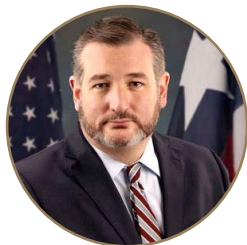
德州联邦参议员 泰德·克鲁兹 (Ted Cruz)