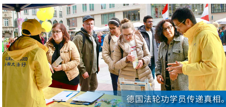
德国法轮功学员传递真相。