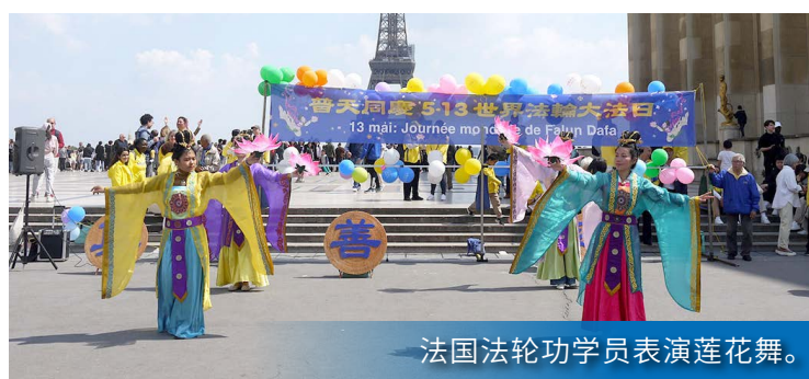
法国法轮功学员表演莲花舞。