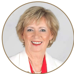
加拿大渥太华国会议员 国会法轮功之友联合主席 史葛洛 (Judy Sgro)