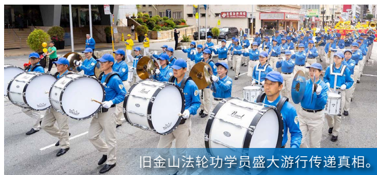
旧金山法轮功学员盛大游行传递真相。