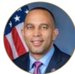
美国众议院少数党领袖 纽约州联邦众议员 哈基姆·杰弗里斯 (Hakeem Jeffries)