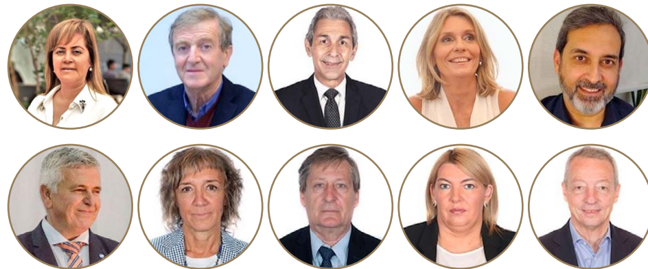
鲁阿尔特、托尔托列洛、费尔南德斯、施密特-利尔曼、帕蒂尼奥、波利尼、弗雷德、托雷洛、伯尔通、曼齐等阿根廷国民议会议员

法轮大法多年来一直是许多人生活中不可或缺的积极组成部分……其践行也对我们的社会产生了切实的效果。……因此我们都在庆祝这个纪念日，并且非常感谢李洪志先生创立这种修炼方法。