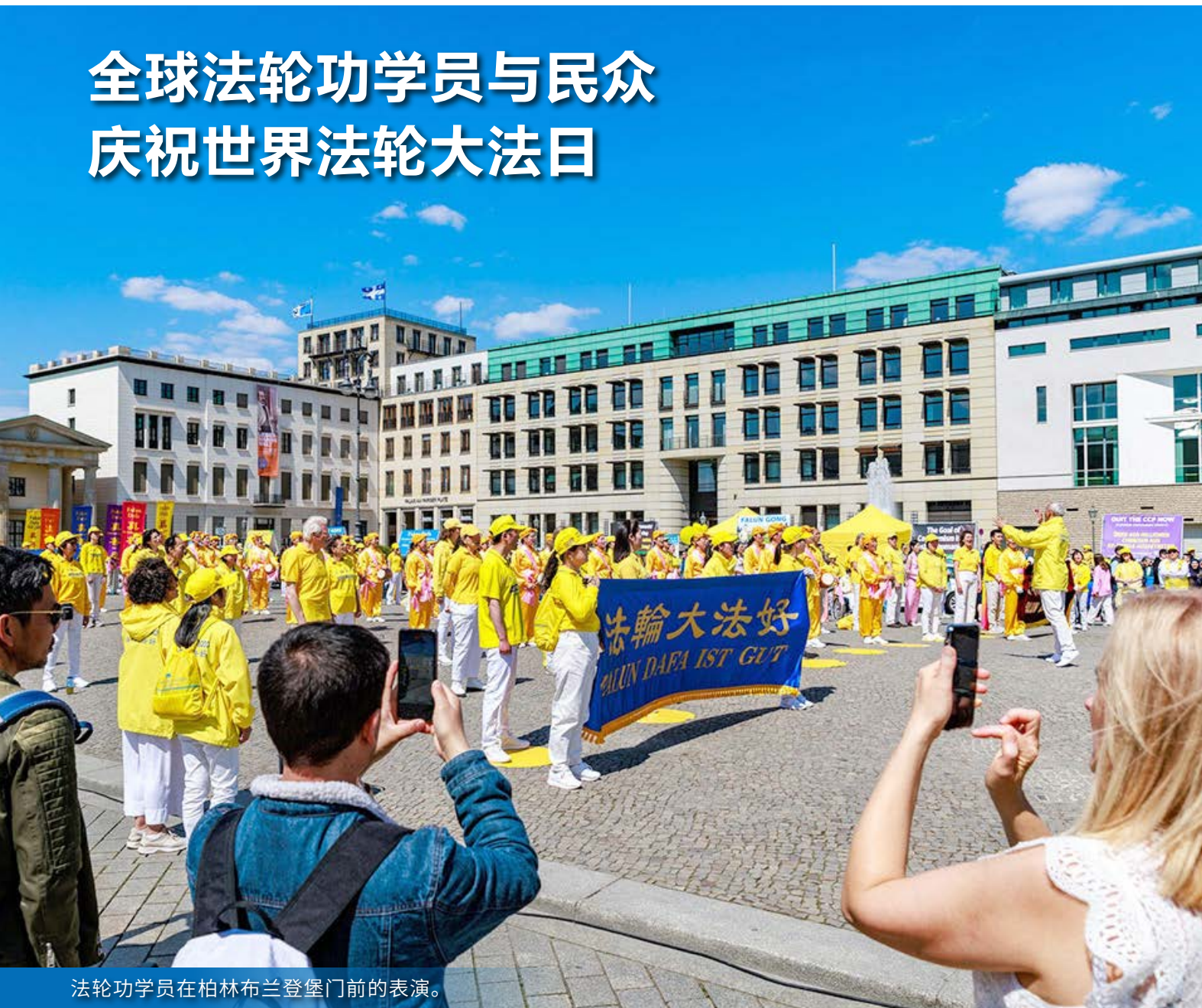
法轮功学员在柏林布兰登堡门前的表演。