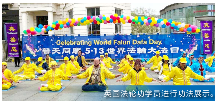
英国法轮功学员进行功法展示。