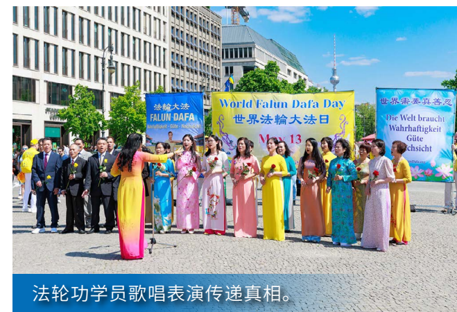
法轮功学员歌唱表演传递真相。