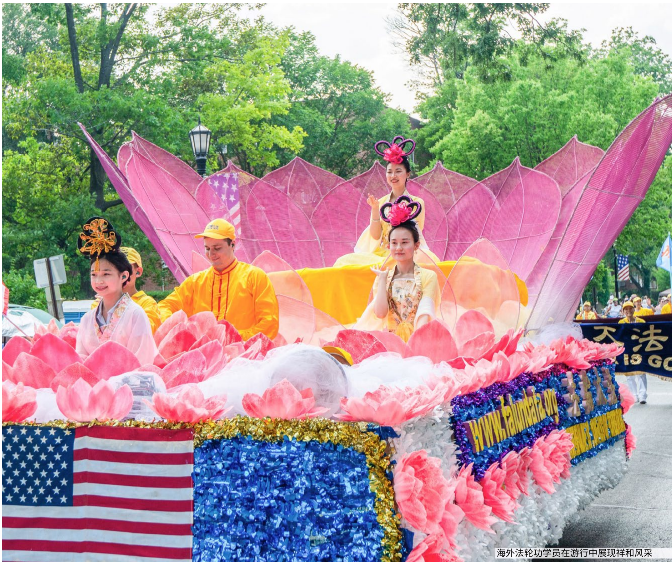
海外法轮功学员在游行中展现祥和风采