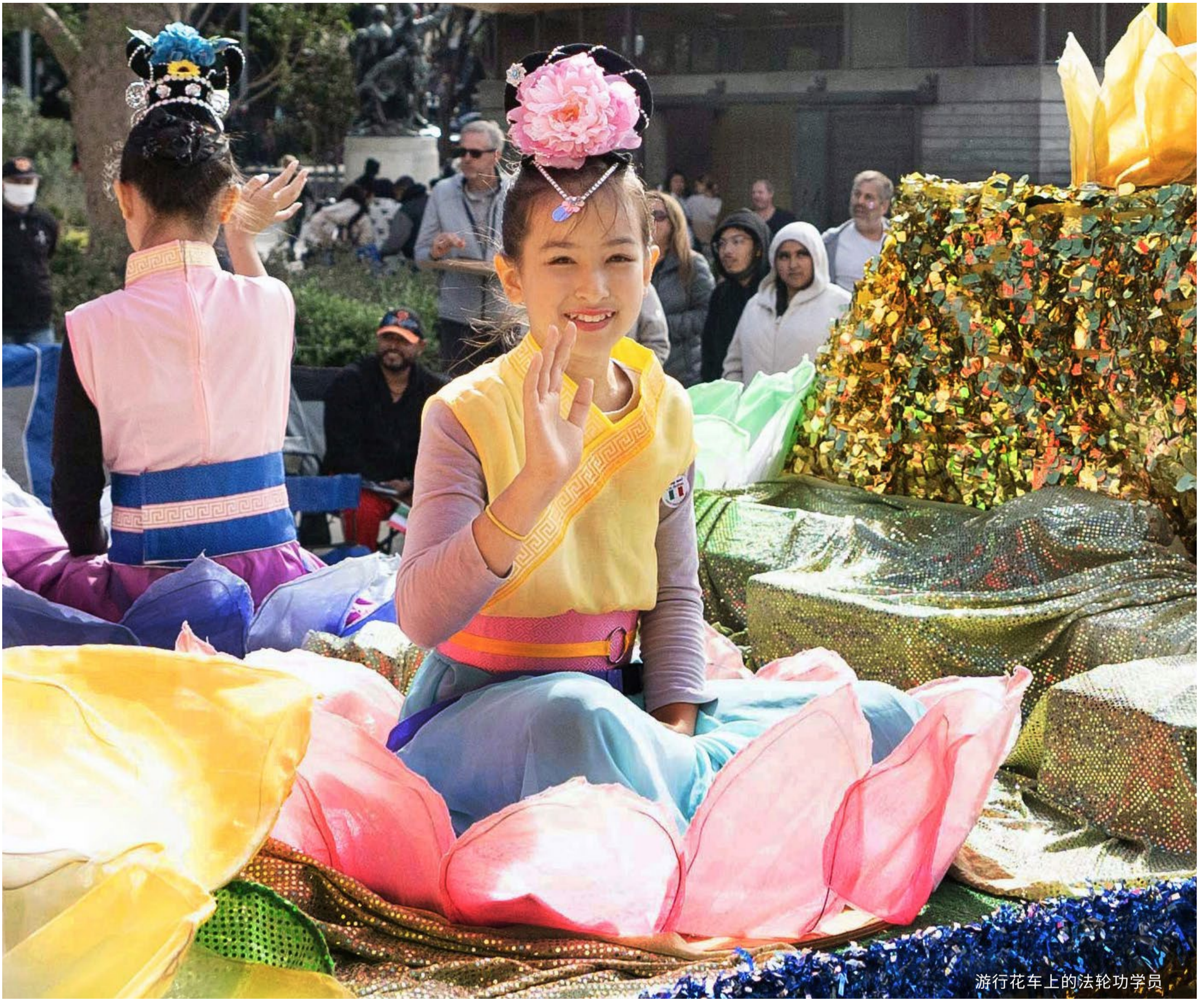
游行花车上的法轮功学员