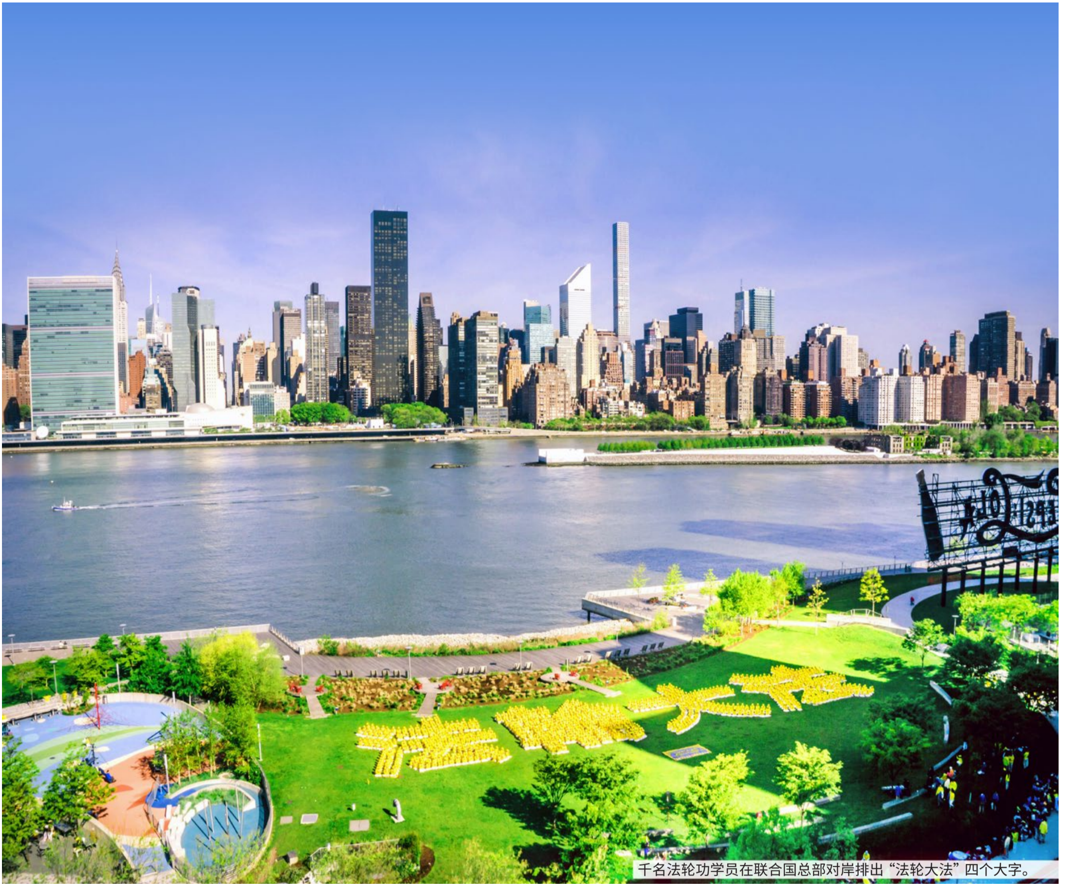
千名法轮功学员在联合国总部对岸排出“法轮大法”四个大字。