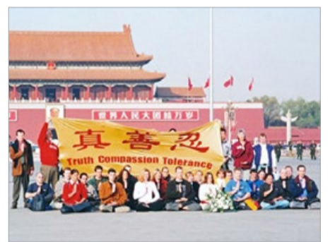
2001 年 11 月 20 日,来自 12 个国家的 36 名西人法轮功学员在天安门广场和平请愿。

2001 年 11 月 20 日,来自 12 个国家的 36 名西人法轮功学员在天安门广场举起写有中英文“真善忍”字样的横幅和平请愿,呼吁停止迫害法轮功。随后 6 辆警车疾驰而至。这些西人遭到警察的殴打和抓捕,后被驱逐出境。该事件震惊了世界。