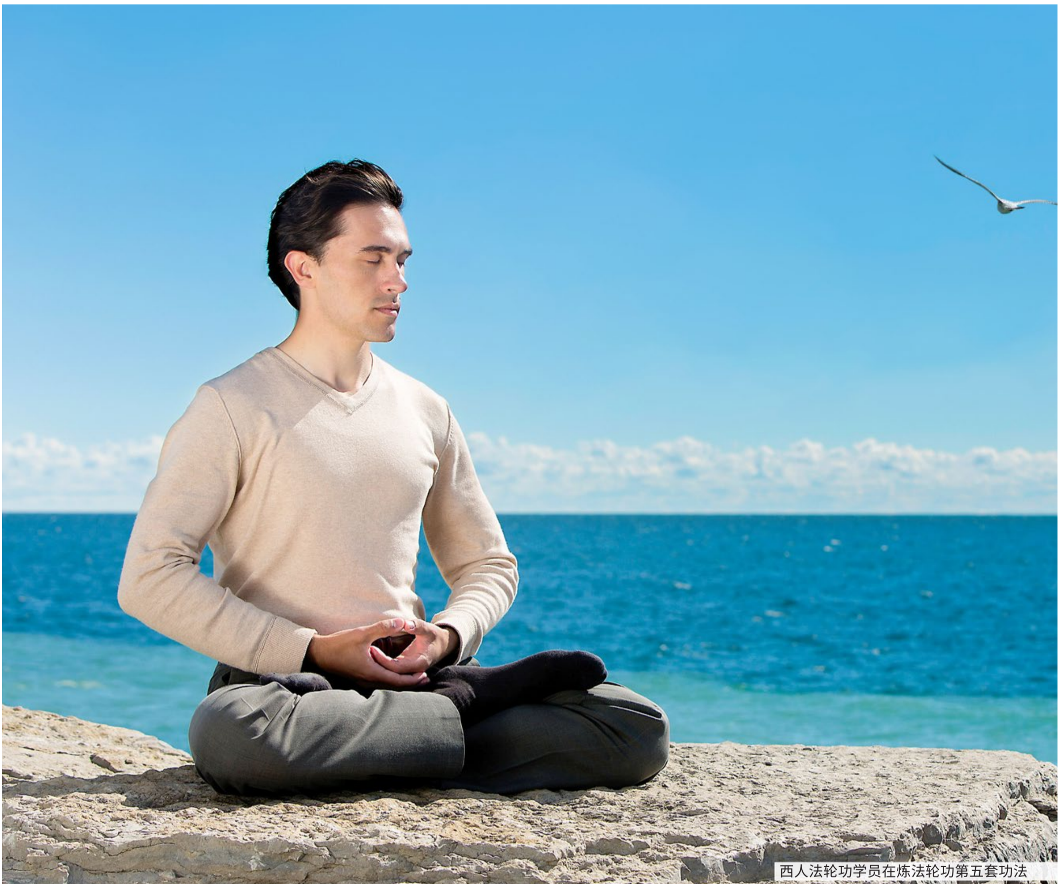
西人法轮功学员在炼法轮功第五套功法