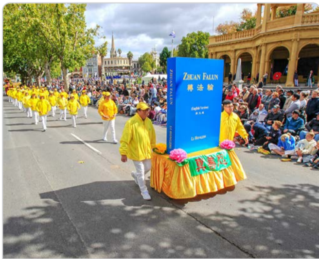
澳洲法轮功学员多次受邀参加各种庆典活动，被赞誉为践行真善忍的模范团体。