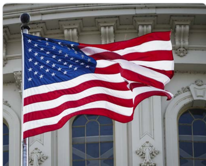
2023年5月13日，美国国旗在国会大厦飘扬，表彰李洪志大师的杰出贡献。

1992年5月13日，李洪志大师在中国长春将法轮大法传出，至今已弘传世界百余国，上亿修炼者身心受益。人们为了纪念这个日子，把每年的5月13日定为“世界法轮大法日”。