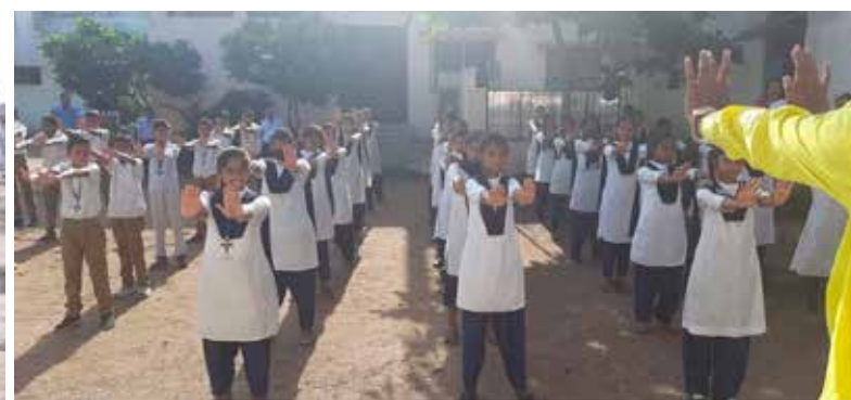
■ 纳巴拉特高中的学生们学炼法轮功的第一套功法。