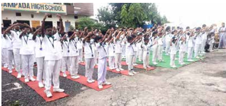
■ 桑帕达修道院学校的学生们在炼法轮功的第二套功法。