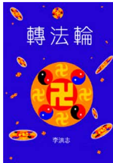
■ 法轮功主要著作《转法轮》第一版的封面照片。

我的专业水平得到了客户的认可，某公司老总指定要和我签约一份二千万的年度合同。单位领导说，这个订单不计为我个人的业绩，但执行工作还由我去做。这就意味着我工作照做，却拿不到二十万元的提成。我坦然接受了领导的安排，有人知道我是修炼人，说我在利益面前放得下，不是一般人能做到的。