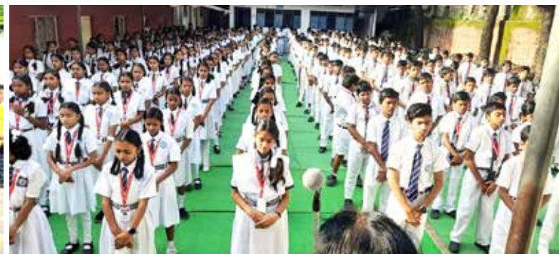
■ 赫曼特贾卡特高中的学生们在炼法轮功。