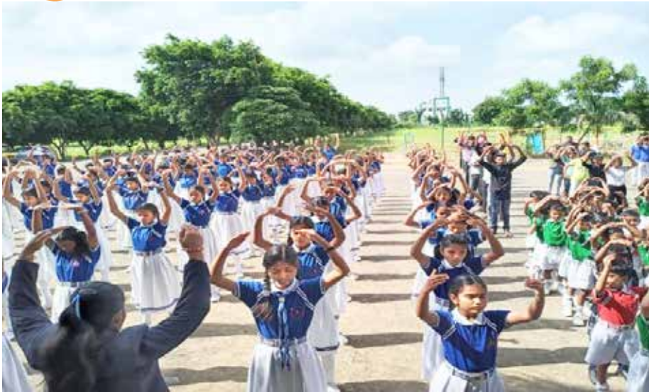
■ 瓦尔达附近的牛津初级学校的学生在炼法轮功第二套功法。

八月七日，萨瓦什利中学五年级至十年的学生们学习了法轮大法的五套功法。一名学生表示：“炼完打坐后，我的压力和烦恼减轻了，我的头脑焕发了活力，负面情绪也离开了我的身体。”她相信法轮功的五套功法能帮助她提升记忆力。