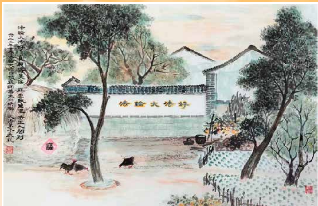
中国画：乡村福音，作者：方外（中国大陆）