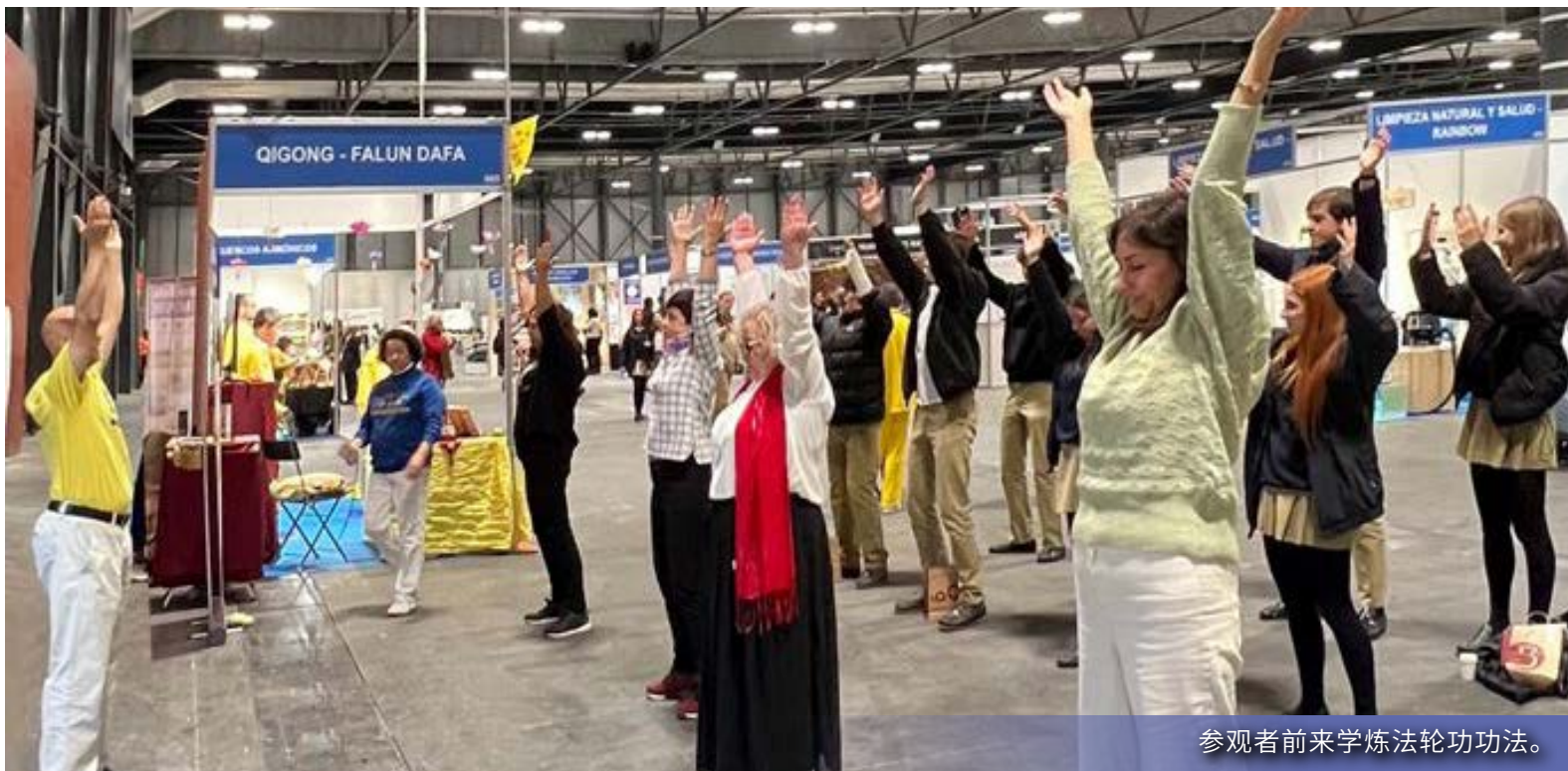
参观者前来学炼法轮功功法。