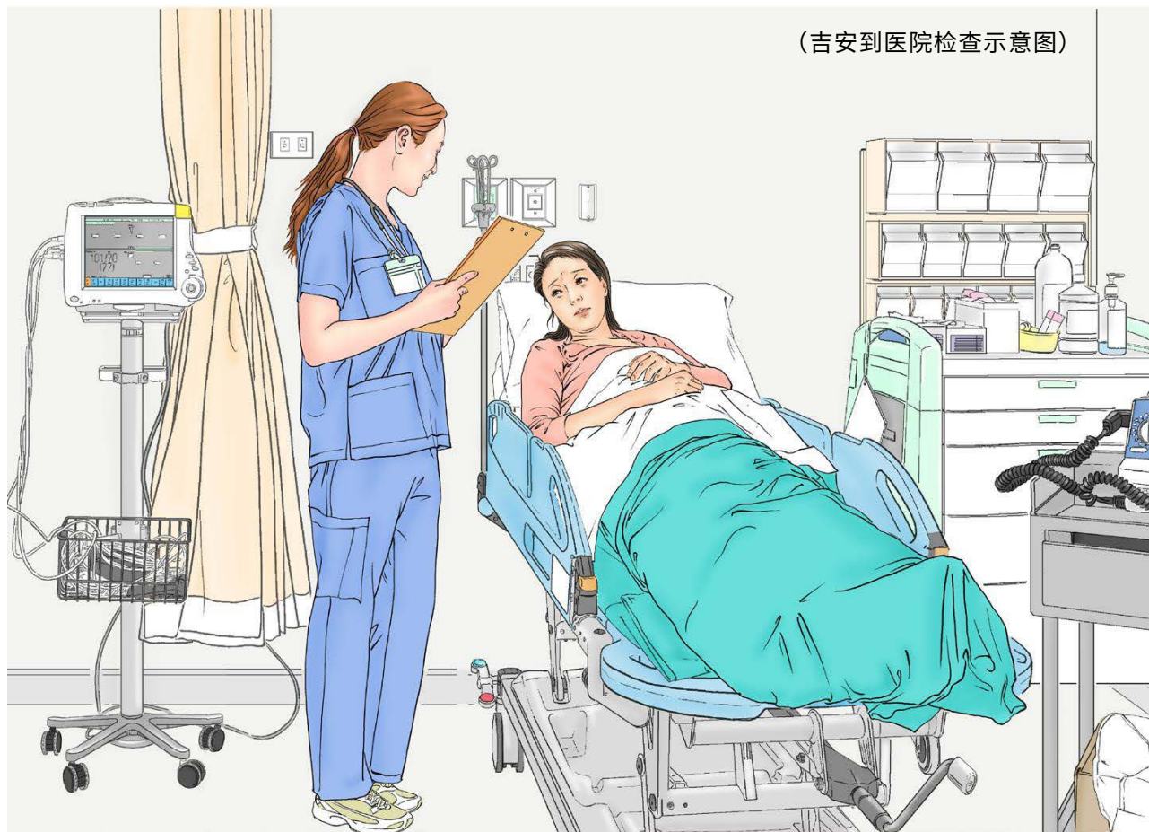
(吉安到医院检查示意图)