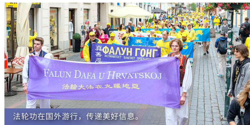
法轮功在国外游行，传递美好信息。