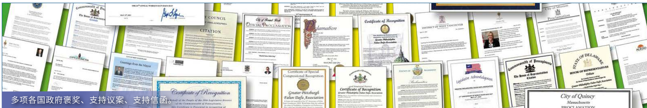
多项各国政府褒奖、支持议案、支持信函。