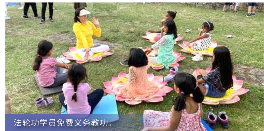
法轮功学员免费义务教功。