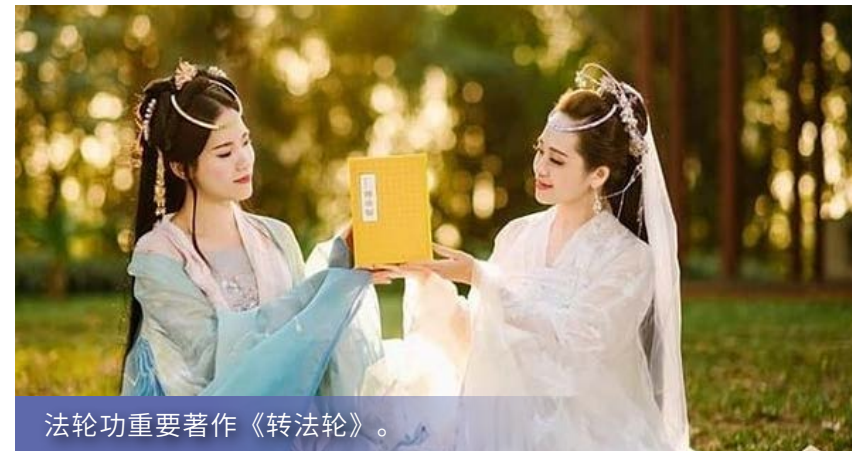
法轮功重要著作《转法轮》。

法轮功，又称法轮大法，是由李洪志先生于1992年5月传出的佛家上乘修炼大法，以真、善、忍为根本指导，包含五套缓慢优美的功法动作。要求修炼者从做好人做起，努力按照真、善、忍标准提升道德。