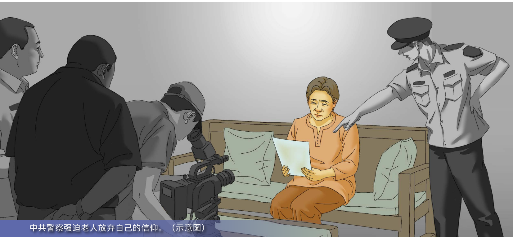
中共警察强迫老人放弃自己的信仰。(示意图)