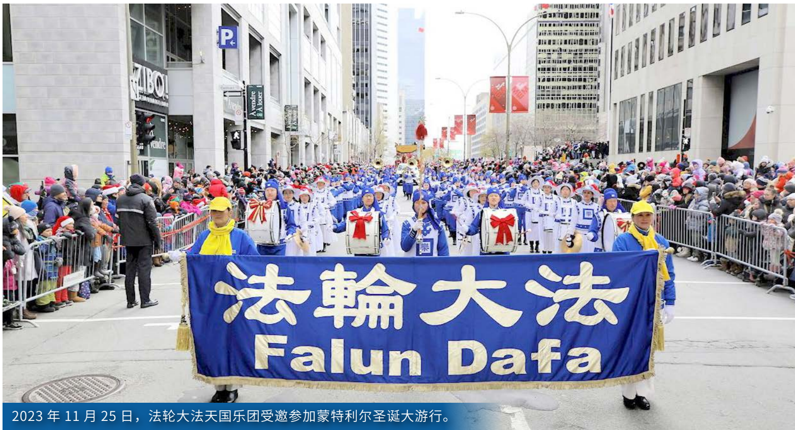
2023年11月25日，法轮大法天国乐团受邀参加蒙特利尔圣诞大游行。