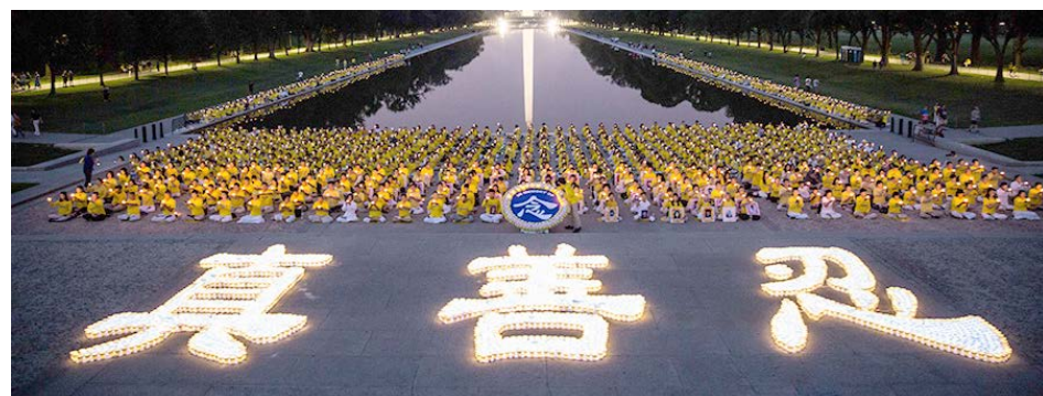
▲ 全球法轮功学员每年7.20都会举行烛光悼念活动，悼念被迫害致死的学员。

在经历了5次被非法抓捕、1次扣押和5年半的冤狱迫害及不断的跟踪骚扰恐吓，于2023年4月22日下