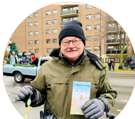
吉恩觉得真善忍的原则没有错。