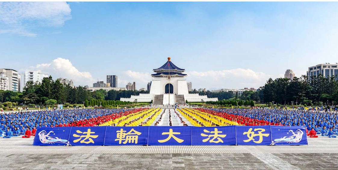
▲ 法轮功学员于排字结束后，举行集体炼功。

观。当天晴空万里，学员们有序入座，场面平静、祥和、壮观，吸引了许多民众、国内外旅客驻足观看。排字结束后，学员们举行集体炼功。