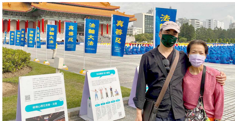
▲ 黄先生与母亲感受到大法的美好。

他看了法轮功著作《转法轮》，从根本上解答了他的疑惑。自学了法轮功的5套功法。他说已经坚持炼了420天了。趁着这次回台湾的机会，他就立刻带着75岁的母亲找到了住家附近的炼功点。■