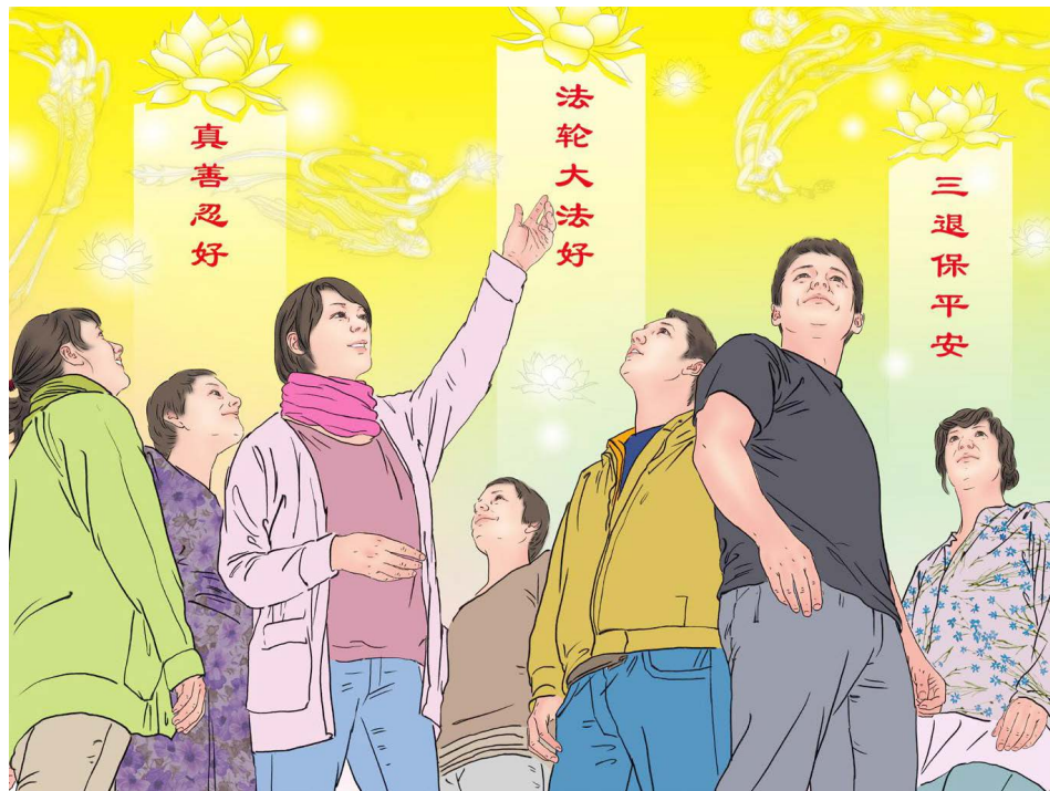
▲ 九字真言“法轮大法好，真善忍好”威力巨大，动念就会得到神佛的保护。

现在瘟疫还在继续着，已经蔓延到了孩子们身上，在此盼望家长们都能了解法轮功真相，退出中共的党、团组织，并帮助孩子退出共青团和少先队组织。远离中共避大难，退出中共保平安。愿所有孩子都能平安。 ▀