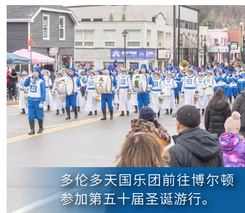
多伦多天国乐团前往博尔顿参加第五十届圣诞游行。