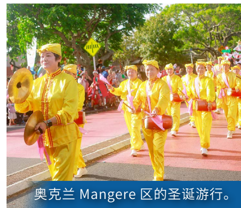
奥克兰 Mangere 区的圣诞游行。