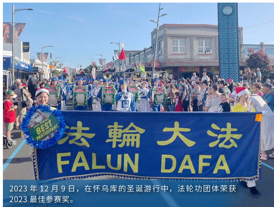
2023年12月9日，在怀乌库的圣诞游行中，法轮功团体荣获2023最佳参赛奖。

陆的法轮功学员正面临残酷的迫害时，吉恩表示：“我觉得真、善、忍的原则没有错，相反是很平和的。我不理解为什么一群如此平和的修炼人会遭到政府的迫害。”