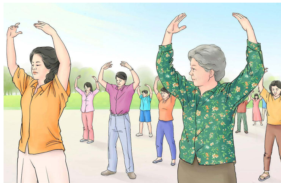
▲ 彩铭修炼法轮功后，身体发生变化。