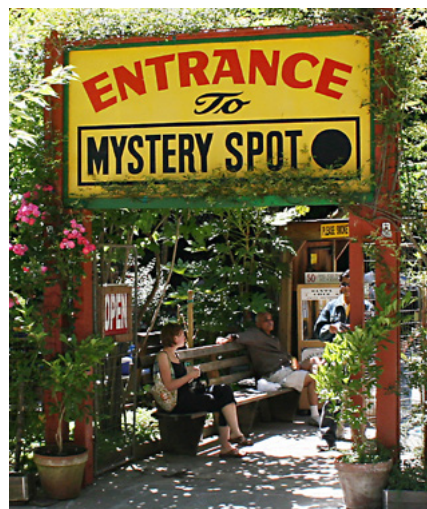
神秘点Mystery Spot 地址： 465 Mystery Spot Rd, Santa Cruz, CA 95065, United States 有机会的话要去亲身体验一番

在小木屋里，还可看到科学完全无法解释的另一种奇异现象。天花板的横梁悬挂着一条铁链，下端绑着一个铅球，