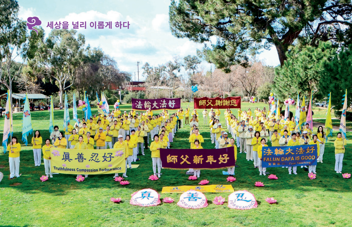
▲미국 로스앤젤레스의 일부 파룬궁 수련생들이 한자리에 모여 리홍쯔 사부님께 새해 축복을 보냈다.