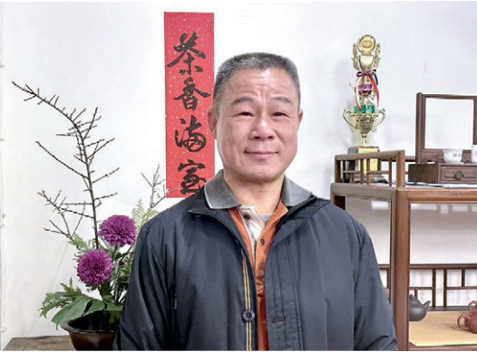
▲암양종으로 고통받던 황차오밍은 건강을 회복했다.