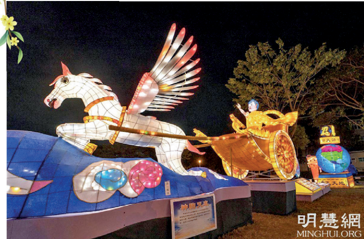
▲대만 등불 축제에 여러 번 참가했던 파룬궁 수련생들이 제작한 '천상의 마차'

새로운 한 해에 복 많이 받으세요 대련을 쓰고 폭죽을 터뜨리니 붉은 악마는 보고 다급히 도망가고 야수는 듣고 피하여 달아나네