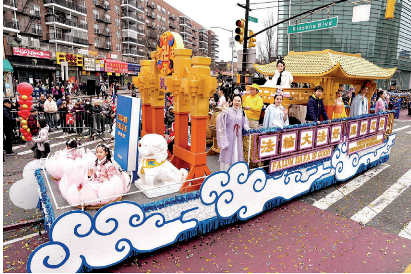
▲뉴욕 플라싱에서 열린 2024년 중국 신년 퍼레이드에 참가한 파룬궁 수련생들.

새로운 한 해에 복 많이 받으세요 삼퇴하면 전염병 피해 평안을 지키고 진선인(眞·善·忍) 마음속으로 염하면 상서로운 건강과 행복을 누리네