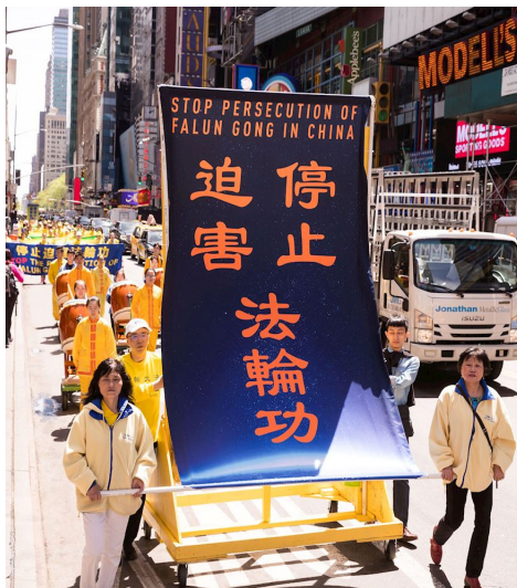
2018年5月11日约两千名法轮功学员在美国纽约举行盛大游行。

州租住处又被福清国保绑架至福清某地几天后，转到福清看守所非法关押，被福清法院非法判刑三年，之后关押在福建龙岩监狱遭受迫