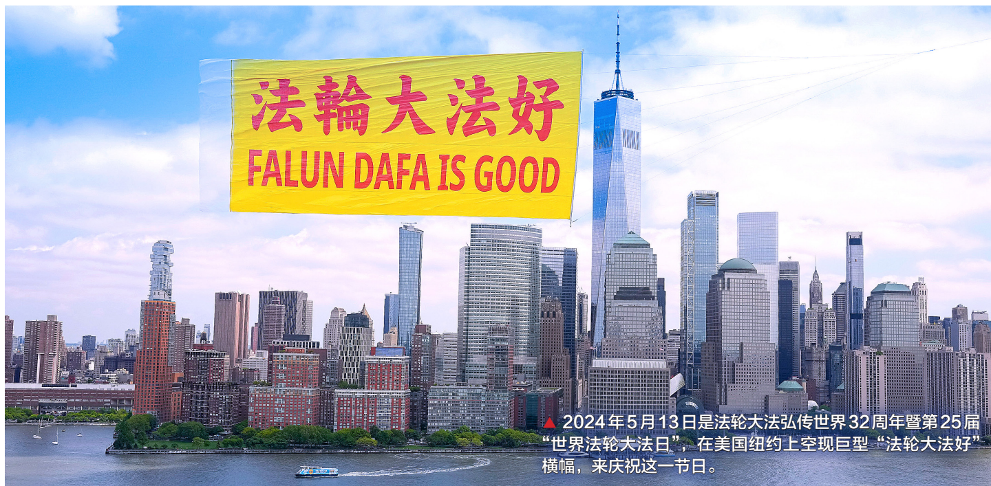
▲ 2024年5月13日是法轮大法弘传世界32周年暨第25届“世界法轮大法日”，在美国纽约上空现巨型“法轮大法好”横幅，来庆祝这一节日。